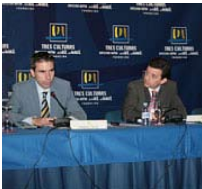
Inauguración del encuentro

La Asociación Euromediterránea o Proceso de Barcelona, iniciativa española creada con ocasión de la Conferencia de Barcelona en 1995, nació como foro de diálogo en el que se reunían, por primera vez, todos los miembros de la Unión Europea junto a sus vecinos árabes e