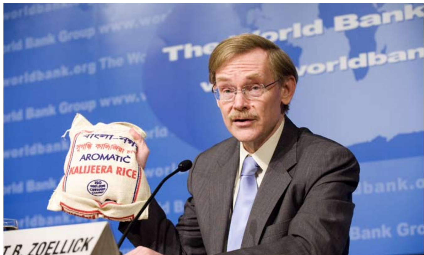
Robert Zoellick, presidente del Banco Mundial

El Banco Mundial anunció además la creación de otro fondo multilateral, consagrado a financiar programas de apoyo a la producción agrícola, que incluyen semillas y fertilizantes.