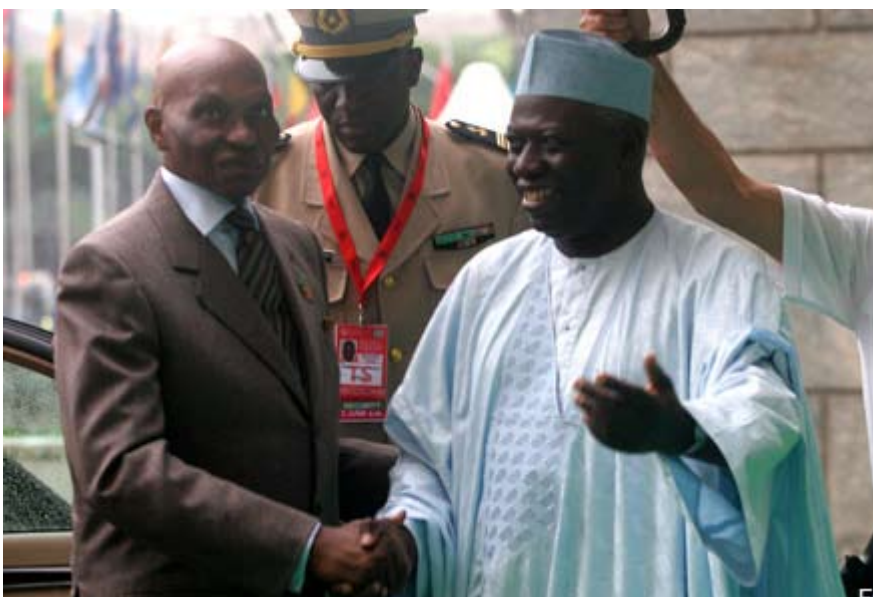
Abdoulaye Wade, presidente de Senegal, es recibido por Jacques Diouf, director general de la FAO

La organización concluye que "se hace por ello vital hacer cuanto antes la transferencia de los fondos comprometidos en Roma hasta los países más afectados a través de programas concretos de recuperación nutricional, distribuciones alimentarias o de entrega de alimentos a cambio de trabajo".