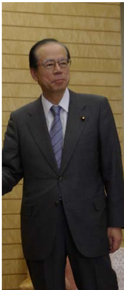
Yasuo Fukuda, primer ministro japonés

Robert B. Zoellick, presidente del Grupo del Banco Mundial, participó en un debate sobre precios de los alimentos organizado en forma conjunta con la Organización de las Naciones Unidas para la Agricultura y la Alimentación, el Programa Mundial de Alimentos de Naciones Unidas y el Fondo