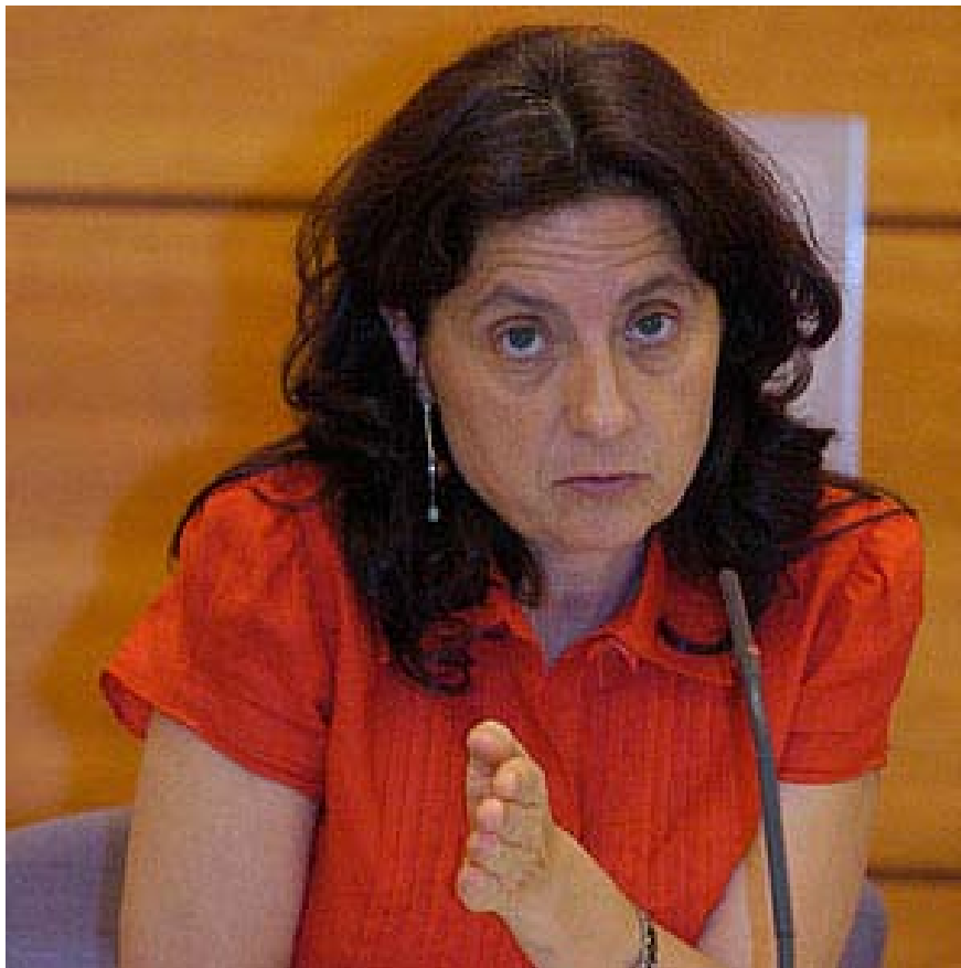
GOBIERNO DE BALEARES

Así, el Plan Director establece una serie de países considerados prioritarios, de acuerdo con su bajo índice de desarrollo humano o con el estancamiento en