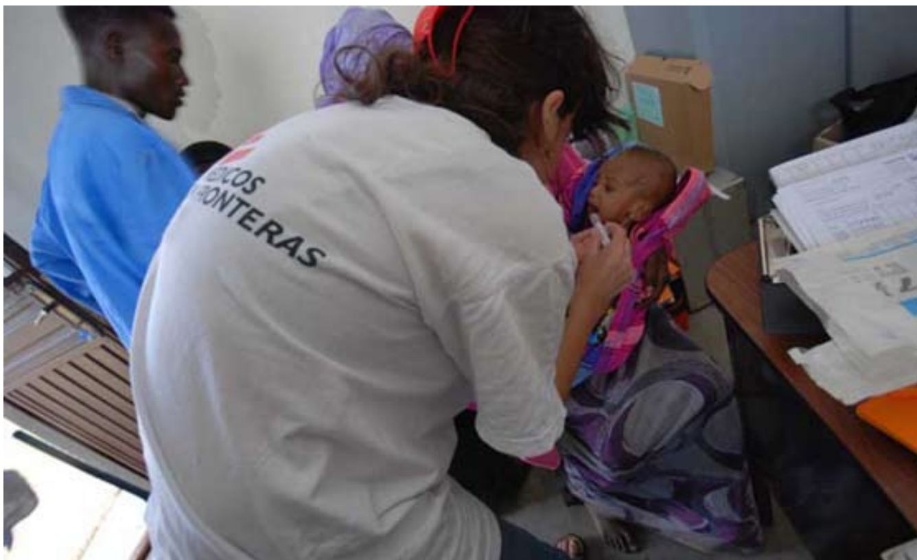
Distrito de Siraro, Etiopía

Además de estas nuevas intervenciones en Oromiya, la organización sigue llevando proyectos con un componente nutricional en la región somalí de Etiopía: en Degahbur, Cherrati, Warder y Fiq. En algunos de estos programas hemos observado en el último mes un importante aumento de casos de niños desnutridos. En Degahbur, por ejemplo, MSF trata actualmente a más de 600 niños desnutridos, el 20% de ellos con desnutrición severa. Teniendo en cuenta que la próxima cosecha no llegará antes de agosto o septiembre, MSF está preparado para intervenir de forma más amplia y sigue de cerca la situación nutricional en la región.