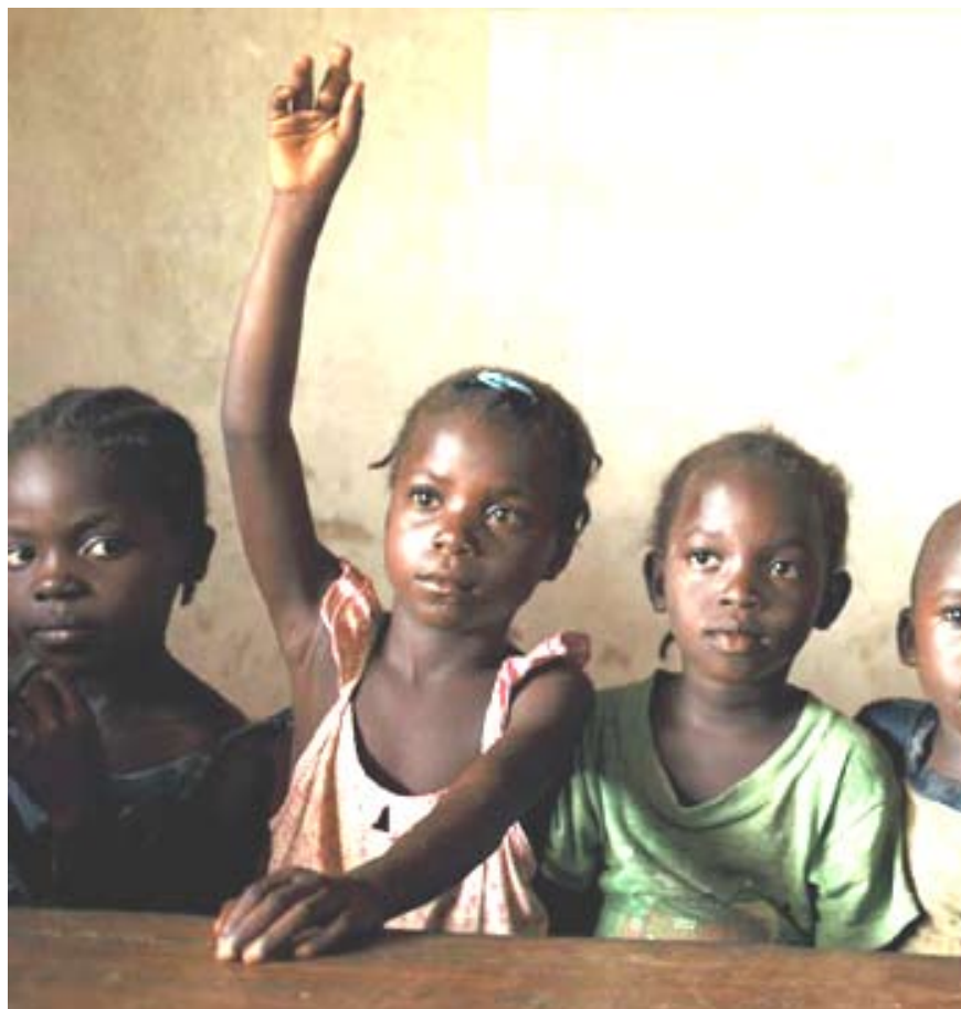
SAVE THE CHILDREN

Save the Children basó sus datos en visitas a Haití, Sudán y Costa de Marfil durante 2007. Allí mantuvo 38 grupos de