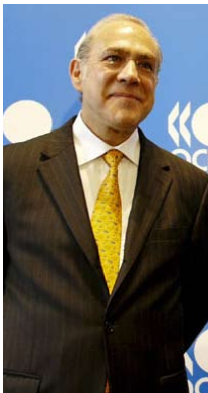
Angel Gurría, secretario general de la OCDE

Los precios de los productos básicos agrícolas se moderarán respecto a los recientes niveles récord, pero en los próximos diez años se espera que su media se sitúe muy por encima de los niveles medios de la última década, cita un nuevo informe.