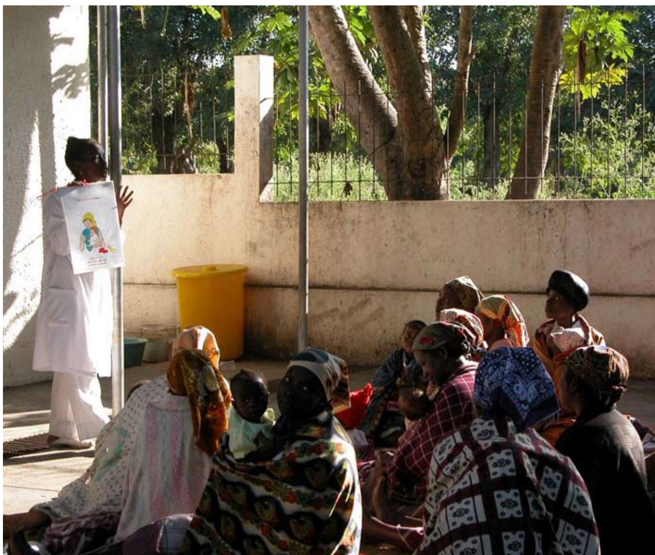
Centro de Investigación de Salud de Manhica, Mozambique

En España, también África ha centrado la atención de un importante galardón. El Premio Príncipe de Asturias de Cooperación fue a parar a cuatro de las organizaciones científicas, sanitarias y humanitarias que lideran la lucha contra la malaria en África. Todo un incentivo para los miles de cooperantes, sanitarios y personal envuelto en esta dura y larga batalla en distintos puntos del continente africano. Y un gran acierto dar a conocer la labor que realizan estas organizaciones en la búsqueda de una vacuna contra la malaria. Desde Futuro Africano, felicitamos a las organizaciones galardonadas, deseando que, tras recoger el galardón y regresar a la dura realidad que viven en el terreno, sigan manteniendo la ilusión.