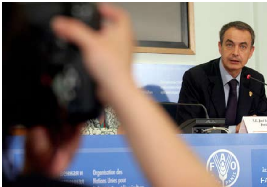
José Luis Rodríguez Zapatero, en conferencia de prensa en la cumbre de la FAO

Por su parte, el presidente del Gobierno español, José Luis Rodríguez Zapatero, en su intervención ante el plenario de la Cumbre, recordó que el alza de los precios puede obstaculizar una de las metas fijadas por la comunidad internacional al inicio de este siglo, la erradicación de la pobreza y el hambre. "Todos tenemos una responsabilidad compartida y la gravedad de la situación exige una respuesta coordinada de la comunidad internacional", aseguró.