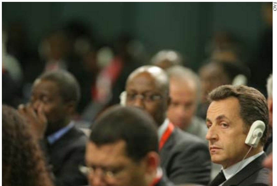
Nicolas Sarkozy, en la cumbre de la FAO

Por su parte, la campaña "Derecho a la alimentación. Urgente", promovida por las ONGD Prosalus, Ingeniería Sin Fronteras, Caritas y Veterinarios Sin Fronteras, consideran que la cumbre de la FAO ha fracasado y denuncia que las "soluciones milagrosas"