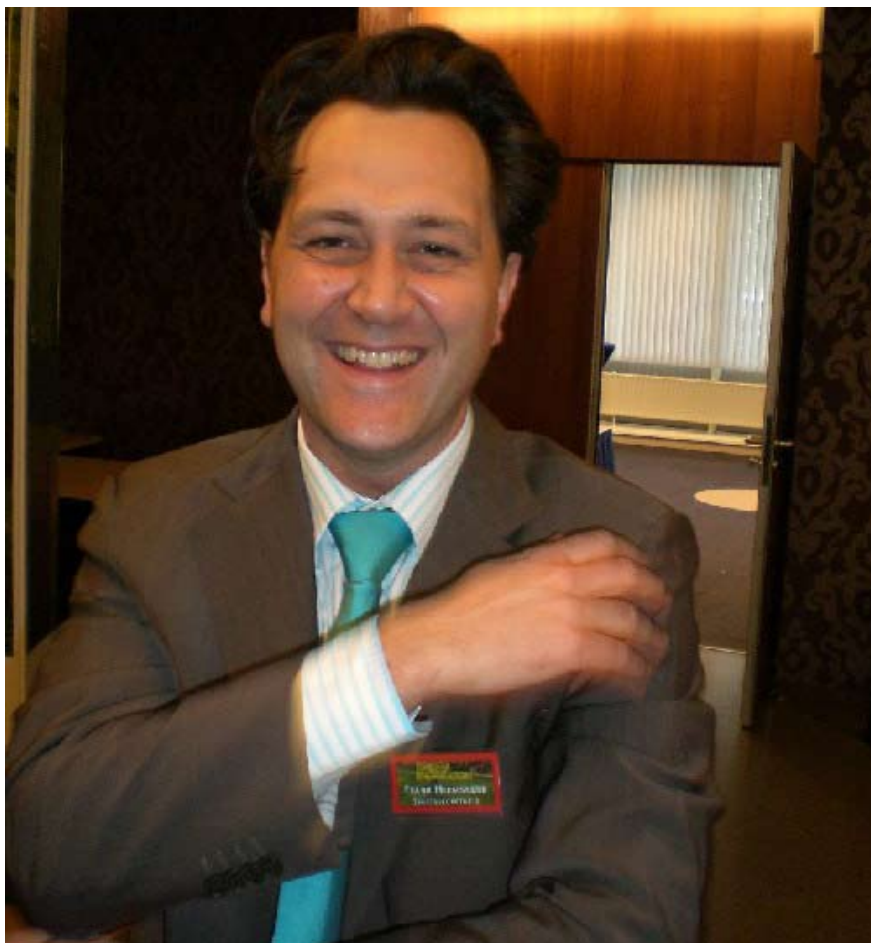
Frank Heemskerck, ministro holandés de Comercio Exterior

El ministro holandés expresó con esta ocasión su disposición de contribuir a favorecer la coordinación entre las em-