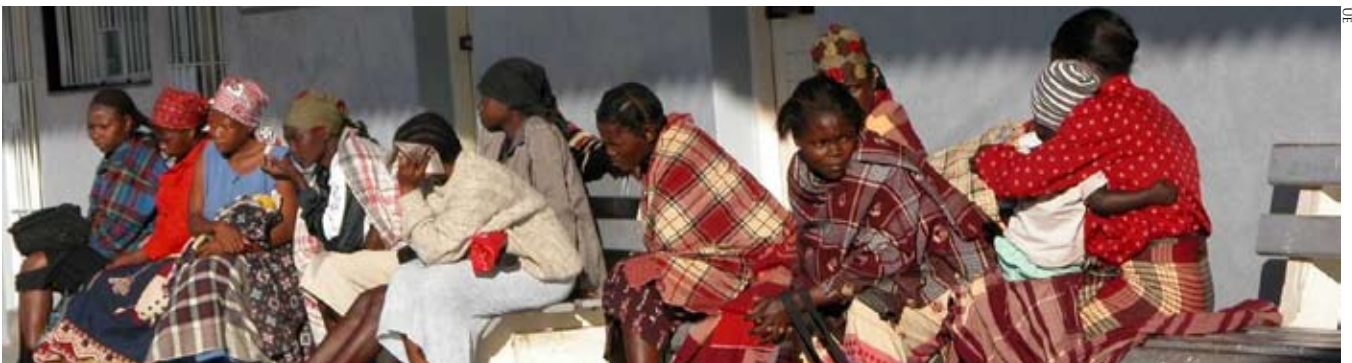
Centro de Investigación de Salud de Manhiça, Mozambique