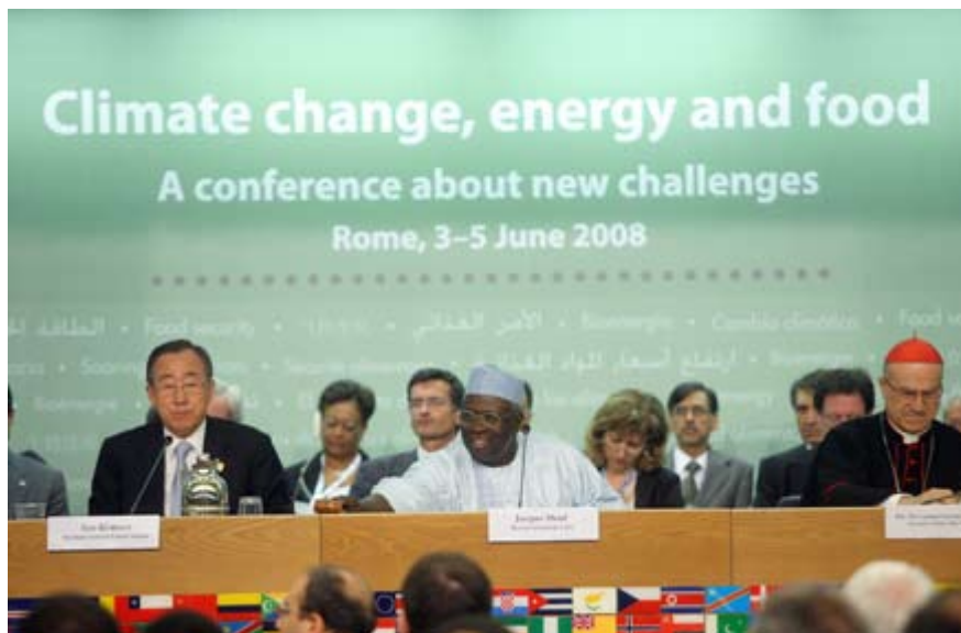
Vista general del plenario en la cumbre en Roma

En la sede de la FAO en Roma se clausuró el jueves la Cumbre de Seguridad Alimentaria Mundial: los Desafíos del Cambio Climático y la Bionergía, que durante tres días reunió a más de 40 Jefes de Estado y de Gobierno con el objetivo de analizar y buscar soluciones a los desafíos que enfrenta el mundo ante la actual crisis alimentaria.