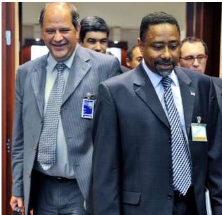
Andrej Šter y Victor Borges, ministros de Exteriores de Eslovenia y Cabo Verde

Recientemente, en la reunión de la troika ministerial Cabo Verde-UE, celebrada en Bruselas el 27 de mayo, se abordaron temas delicados, tales como la lucha contra el tráfico de drogas a Europa a través de Cabo Verde, el establecimiento de acuerdos que permitan la migración legal de caboverdianos a la UE y la integración completa de los súbditos de Cabo Verde que viven actualmente en la