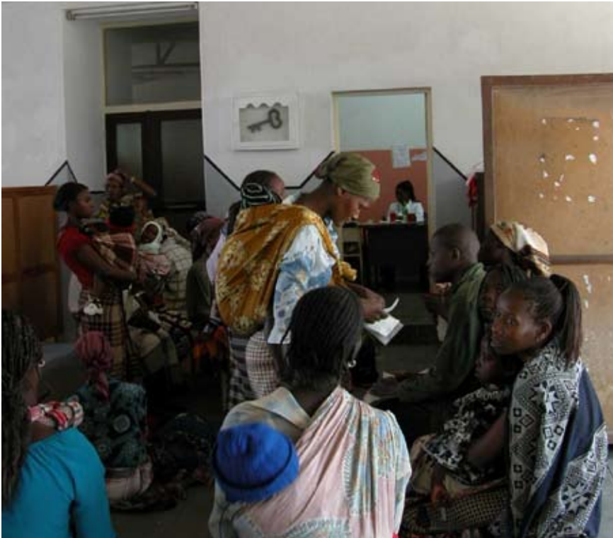
Centro de Investigación de Salud de Manhica, Mozambique

Las organizaciones que lideran en África la lucha contra la malaria han sido distinguidas con el Premio Príncipe de Asturias de Cooperación Internacional 2008, según anunció en Oviedo el jurado responsable del mismo.