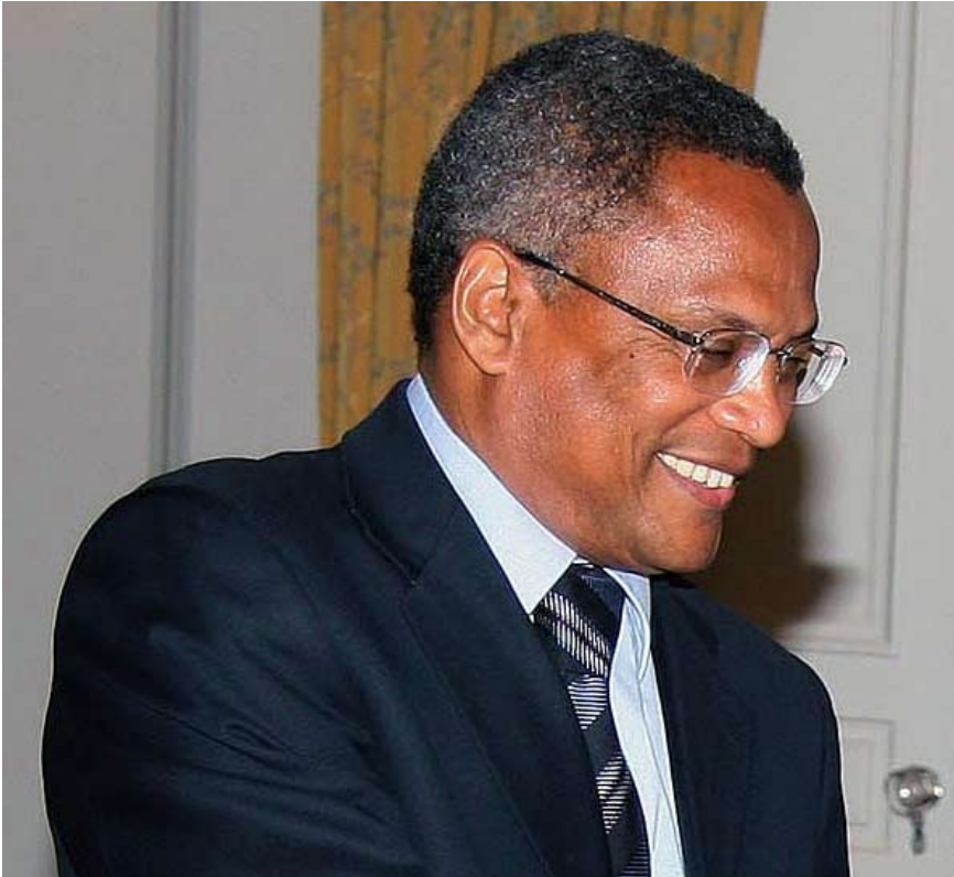
GOBIERNO DE AZORES