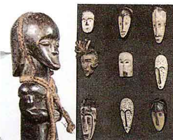
Esculturas de ébano y gran variedad de máscaras africanas. S. NEGRO