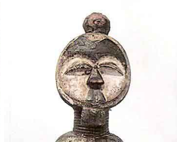
Figura bakwele utilizada en el culto de los muertos, perteneciente a la colección Bescós. S.N.