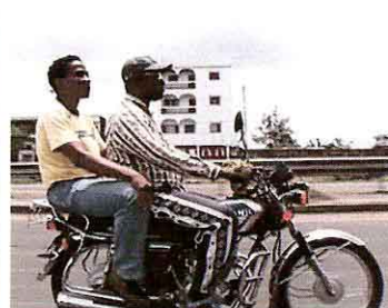
Un fotograma de "Africalls?". CASA ÁFRICA