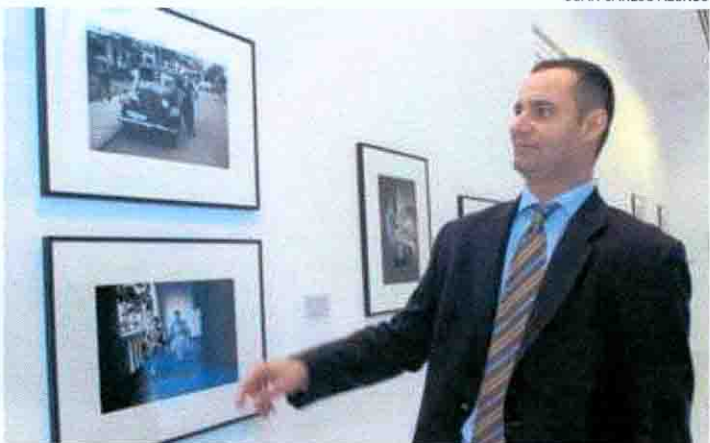
MANUEL HDEZ. SANJUAN/WE ARE HERE FILMS