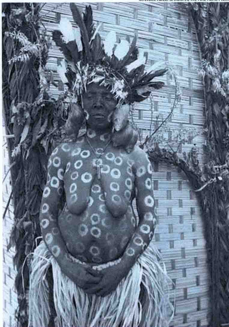
«Aquella señora mayor nos llamó mucho la atención. Llevaba toda su parafernalia decorativa y ritual, pero entre sus pechos lucía una cruz brillante que le habían regalado en la misión», recuerda Hernández Sanjuán.

Para el comisario de la muestra, el material recopilado durante los dos años que duró la expedición de Hermic Films son, sin duda, «la mejor, más importante y destacada muestra del cine documental colonial español en el África negra, tanto por su relevante calidad estética y artística como por sus contenidos y muy diversos intereses históricos, audiovisuales, culturales y antropológicos». Reconoce Ortín que durante décadas, estas producciones «han sufri-