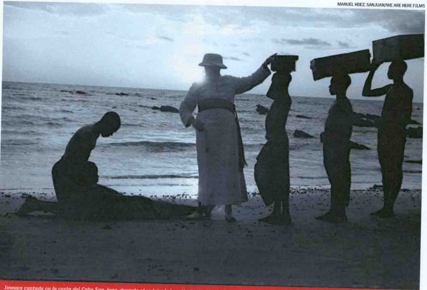
Imagen captada en la costa del Cabo San Juan, durante el rodaje de la película Una cruz en la selva , con los misioneros españoles.